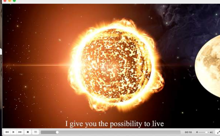
李爽, 《THER (Poor Object) 以太》(2021), 视频, 18分28秒