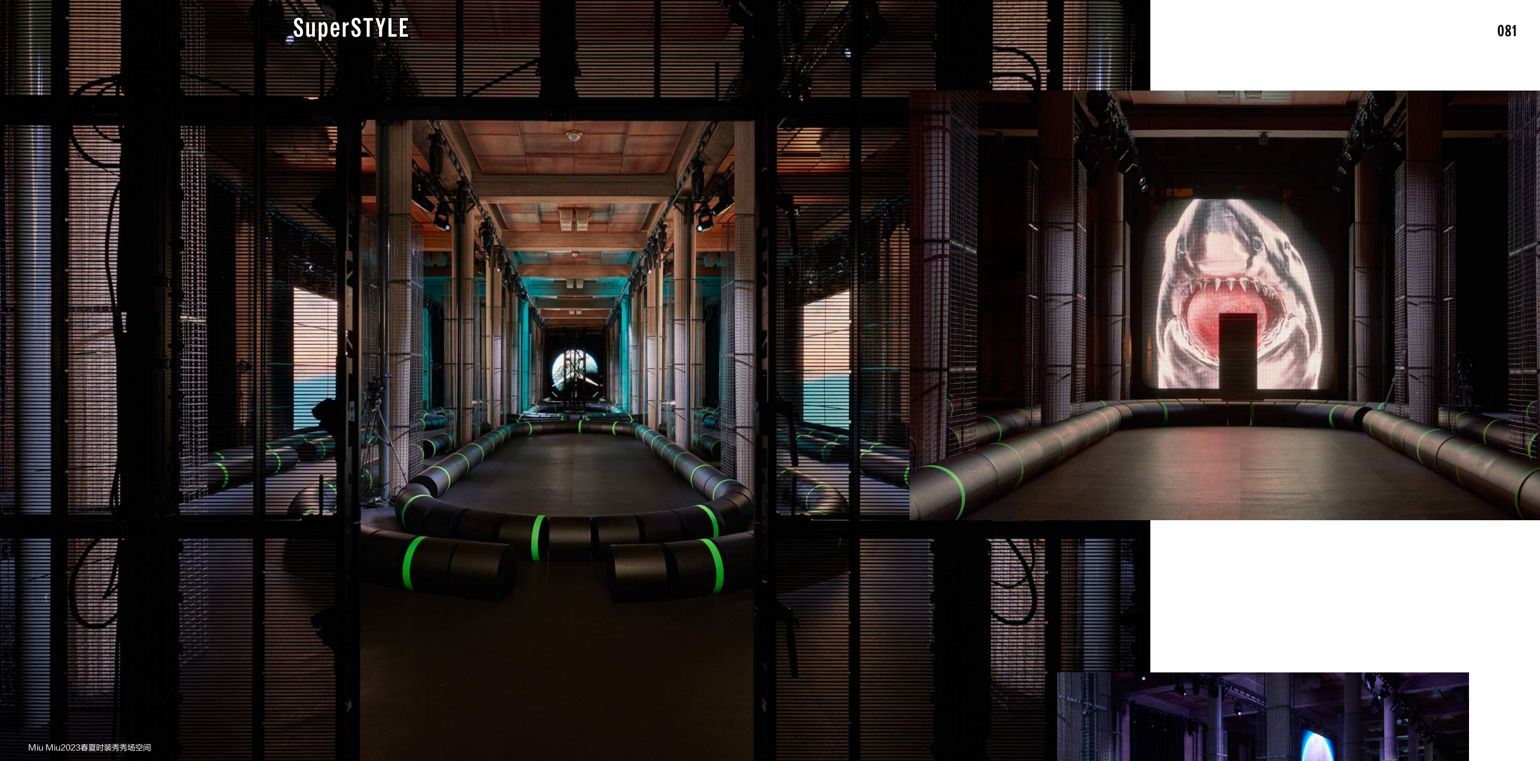
Miu Miu 2023春夏时装周秀场空间

Miu Miu 2023春夏时装周现场，李爽联手AMO建筑事务， 将巴黎耶纳宫(Palais d'Iena)重塑为现实中的未知一面，犹如有形潜艇电线设施， 支撑看似无形的同步数字现实。时装秀化身沟通与转化之境— 艺术介入延伸至音乐人Eli Osheyack创作的音景， 设想为一系列遗失讯息，音信未曾传递，因而无人知晓。