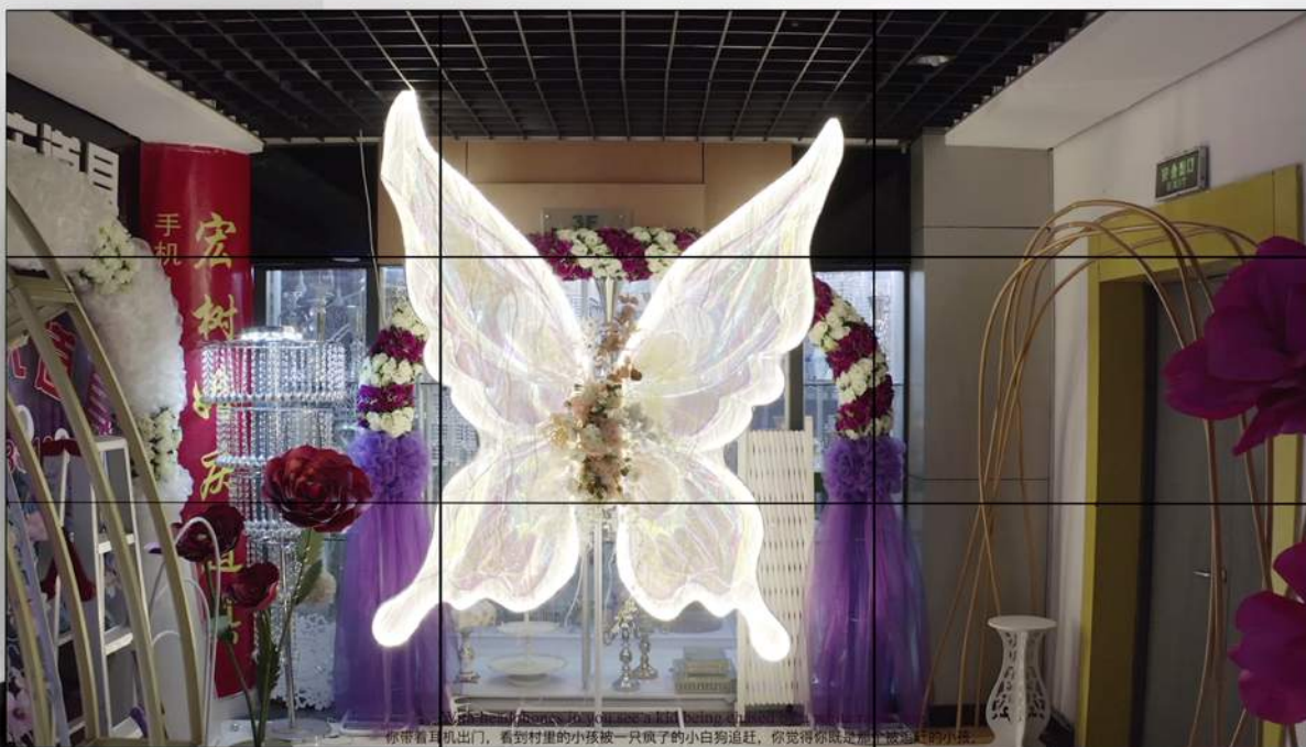
李爽,《I Want to Sleep More but by Your Side只想在你枕边长眠》(2018-19),三屏视频装置