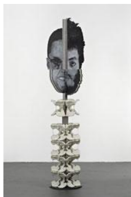
Mark Titchner Alpha in situ , 2008 Jesmonit, Stahl, Ölfarbe, mitteldichte Holzfasertafel, Schnur Ca. 255 x 70 x 70 cm