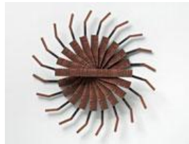
Mark Titchner It's all for you (Dreaming and doing) , 2008 Holz, Harz, Stahl, Acrylfarbe, Oxidrot Durchmesser: 101 cm, Tiefe: 24 cm