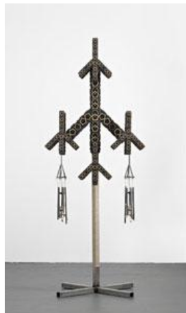
Mark Titchner Chord of Glory , 2008 Holz, Stahl, Acrylfarbe, Harz, Schnur 210 x 85 x 85 cm