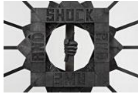
Mark Titchner Taurus (Shock and awe) , 2008 (Detail) Stahl, Jesmonit, Harz, Acrylfarbe, Graphit, Holz Ca. 230 x 120 x 65 cm