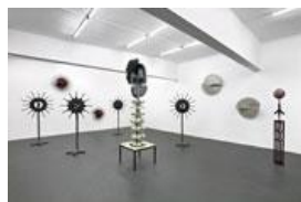
Mark Titchner Installationsansicht, „Plateau Aurora Borealis“, 2008

Radskulpturen auch mit Slogans wie „Peace and Love“, aber eben auch „Shock and Awe“ und eine zum Kampf geballte Faust, die sich aus dem Kraftzentrum dieser schwarzen Sonnen dem Betrachter entgegenstreckt und eine Totenkerze hält ( Peace and Love (Dreaming and Doing) oder Draco (Shock and Awe) ).