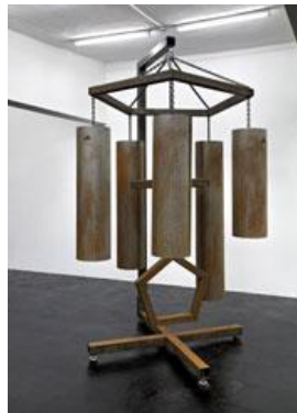
Mark Titchner So much noise to make a silence (major) , 2008 Stahl und Fixierung 350 x 180 x 180 cm