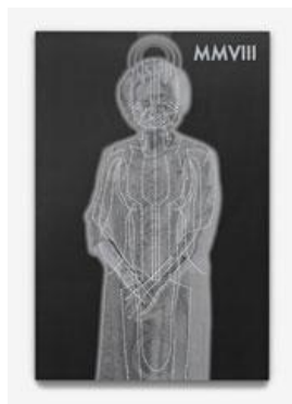
Mark Titchner Young God (MT - Silber) , 2008 Siebdruck auf Wandtafel 120 x 180 x 6 cm Unikat