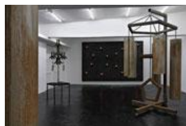
Mark Titchner Installationsansicht, „Plateau Aurora Borealis“, 2008