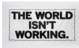
Mark Titchner The world isn't working , 2008 Digitalfotografie auf Vinyl, Nieten 240 cm x 480 cm