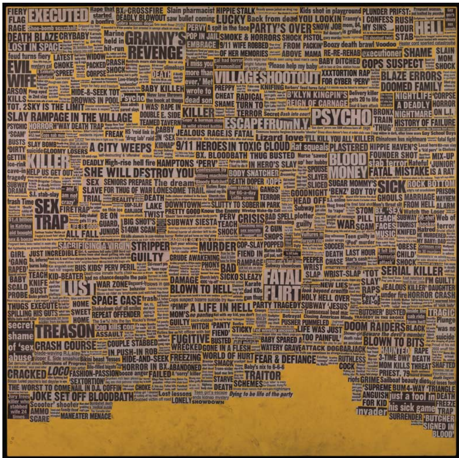
ABOVE UNTITLED (YELLOW COLLAGE) 2007